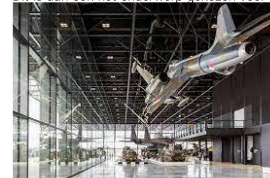
Figuur 2: Nationaal militair museum

Een belangrijke eerste stap naar duurzaam materiaalgebruik is het monitoren van de milieu-impact van de toegepaste (constructie)materialen in een ontwerp. Dit maakt het materiaalgebruik en de bijbehorende milieu-impact inzichtelijk en meetbaar. Het monitoren kan zowel op materiaal-, element- als gebouwniveau. Dit is dan ook het onderwerp gekozen voor de ketenanalyse.