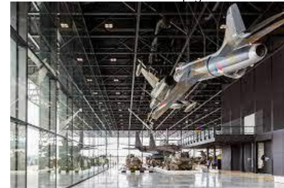
Figuur 2: Nationaal militair museum

Een belangrijke eerste stap naar duurzaam materiaalgebruik is het monitoren van de milieu-impact van de toegepaste (constructie)materialen in een ontwerp. Dit maakt het materiaalgebruik en de bijbehorende milieu-impact inzichtelijk en meetbaar. Het monitoren kan zowel op materiaal-, element- als gebouwniveau. Dit is dan ook het onderwerp gekozen voor de ketenanalyse.