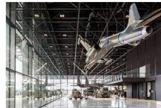
Figuur 2: Nationaal militair museum

Gezien het aandeel van het materiaalverbruik van de hoofddraagconstructie (ca. 60%) en het invloedsgebied van de constructief ontwerper ligt de nadruk op het aspect 'materiaalverbruik'. Dit is dan ook het onderwerp gekozen voor de oorspronkelijke ketenanalyse.