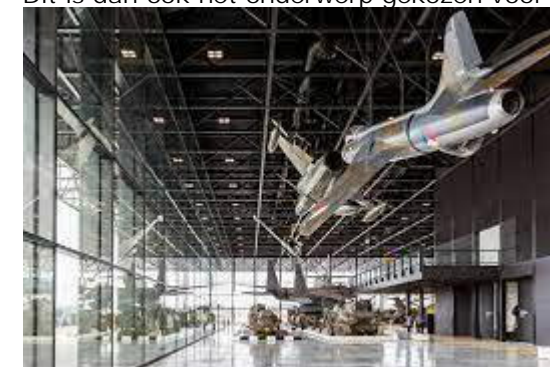
Figuur 2: Nationaal militair museum

Een belangrijke eerste stap naar duurzaam materiaalgebruik is het monitoren van de milieu-impact van de toegepaste (constructie)materialen in een ontwerp. Dit maakt het materiaalgebruik en de bijbehorende milieu-impact inzichtelijk en meetbaar. Het monitoren kan zowel op materiaal-, element- als gebouwniveau. Dit is dan ook het onderwerp gekozen voor de ketenanalyse.